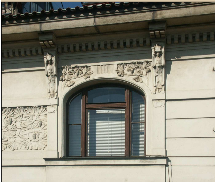
okno - celkový pohled z exteriéru