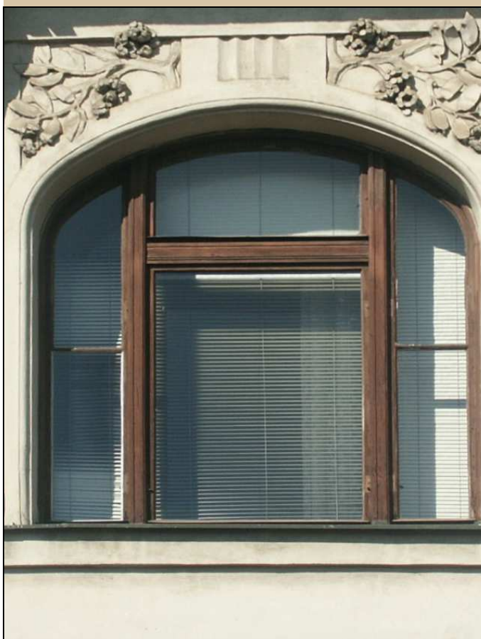
okno -pohled z exteriéru

NÁVRH: repasovat, ponechat na původním místě, zachovat kličky, závěsy, zasklení (je-li historické), obnovit původní barevnost oken, bude-li zjištěna, nebo provést nátěr vnější strany vnějšího okna středně hnědý a zbývající části smetanový, s výjimkou kliček natřít i kování – viz stávající stav Obnovit původní barevnost podle průzkumu barevnosti oken. Z interiéru obnovit bílý nátěr, z exteriéru obnovit povrchovou úpravu, shodnou jako u již rekonstruované části C. Viz technologický postup TP/117.