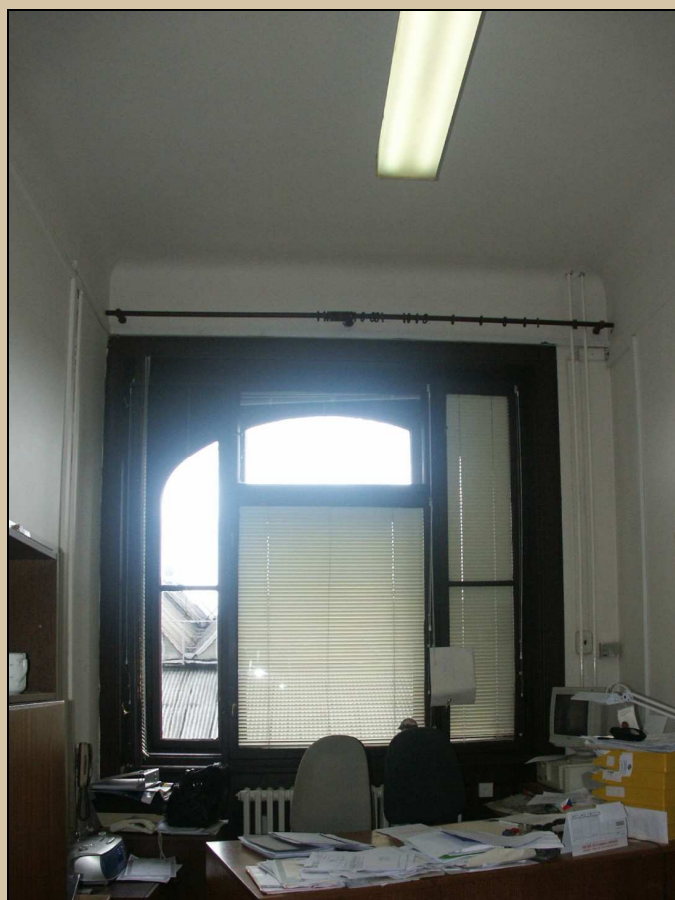
okno – celkový pohled z interiéru